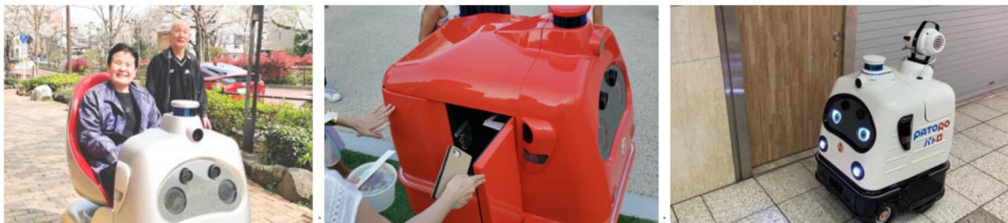
ライフロボットの地上、地下空間での活用イメージ

(左：ラクロでの散歩 中：デリロでのフードデリバリー 右：パトロでの地下街消毒)