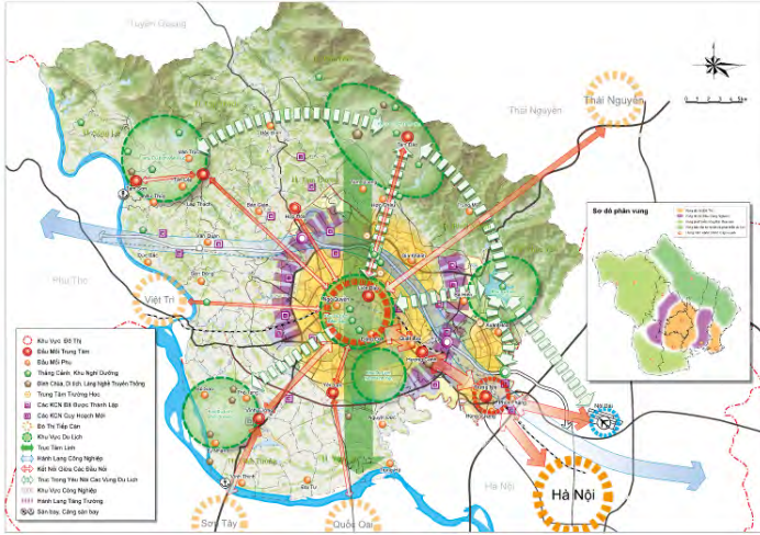
省の都市システム発展方針図