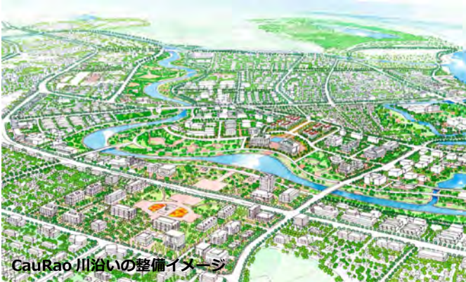
Cau Rao 川沿いの整備イメージ