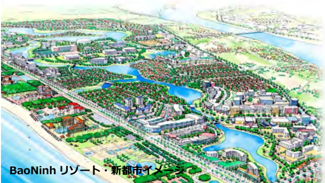
Bao Ninh リゾート・新都市イメージ

ベトナム中部 Quang Binh 省の中心である Dong Hoi 市が、2025年に第2級都市になることを目標とした都市基本計画の見直しを実施した。特に「省都に相応しい都市中心部の形成」、「国際観光都市への発展」と、「災害に強い都市づくり」を目指して、計画の提案を行った。