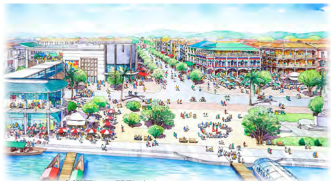
Dong Hoi 市場周辺再開発イメージ