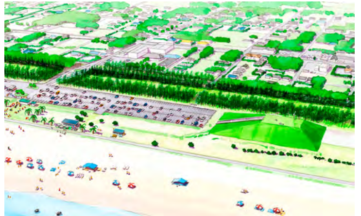
本須賀海水浴場の盛土施設イメージ

発注者 千葉県山武市 計画概要 山武市の津波対策 100 年計画策定のための資料作成 計画工期 2012 年 4 月～ 2013 年 3 月