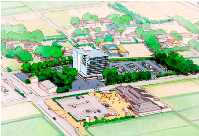
(仮称) 蓮沼タワーのイメージ