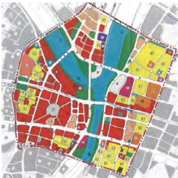
計画地の土地利用計画図